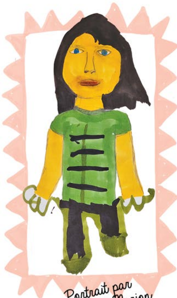
Portrait par Paul et Marion

L'année 2021-2022 pourrait se résumer ainsi: transition d'une période de pandémie vers une période de déconfinement, puis de retour à une vie quelque peu normale, déploiement de multiples partenariats au service des familles de la Basse-Ville. Du milieu de vie si bienveillant avec les nouveaux parents, les activités de la Bécane qui font une véritable jambette à la glissade de l'été, en passant par les petits explorateurs qui permettent de s'initier au plein-air à deux pas de la maison, puis la nouvelle programmation 0-5 dans le quartier St-Malo : nous pouvons être fierEs de nos réalisations! Quel accomplissement de contribuer à cette mission avec mes collègues du conseil d'administration, surtout maintenant que nous pouvons nous réunir en personne!