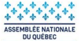
Catherine Dorion Députée de Taschereau